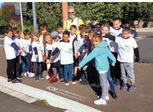
« Mon école, mon cours d'eau », Rignac.

Pour en savoir plus, n'hésitez pas à nous contacter : SMBV2A 16, rue de la Muraille 12390 RIGNAC 05.65.63.58.21 contact@aveyronamont.fr Chargée de mission, animatrice du contrat de rivière : Marion Sudres