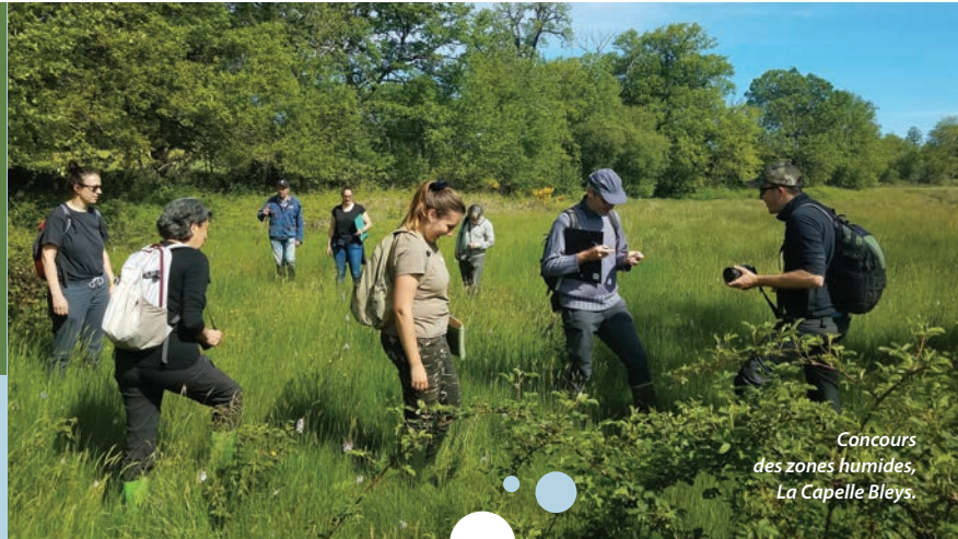
Concours des zones humides, La Capelle Bleyes.

Ainsi, nous continuons à investir dans des actions au bénéfice des générations actuelles comme futures.