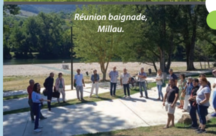
Réunion baignade, Millau.