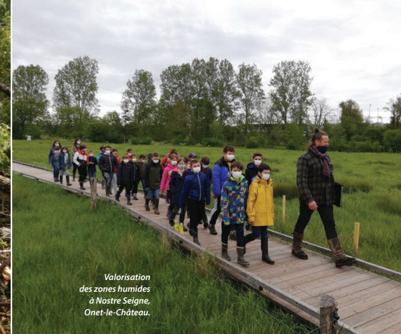
Valorisation des zones humides à Nostre Seigne, Onet-le-Château.