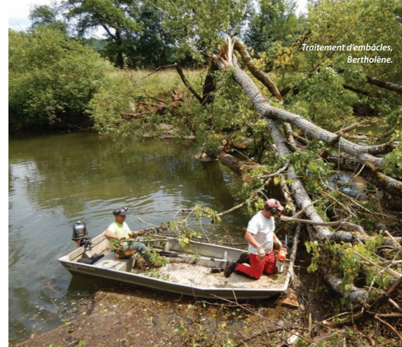
Traitement d'embâcles, Bertholène.

35 080 données de débits collectés sur les Serènes, l'expertise du PNR Grands Causses mobilisée sur l'état de la ressource du causse de Sévérac.