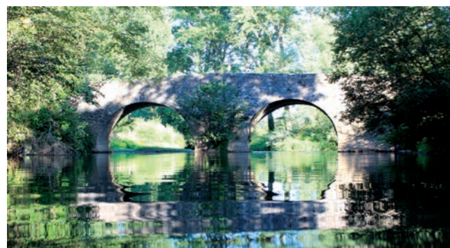
Pont de Montrozier, entre Gages et Bertholène.