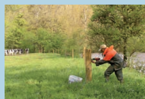
Pose de clôture en bordure de la rivière Aveyron (commune d'Olemps)