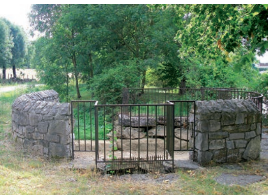
Perte du trou du Souci (Pierrefiche d'Olt)