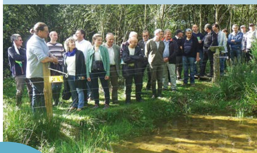
Inauguration de la zone humide de Maymac (Rignac) le 16 septembre 2015

Après avoir largement contribué à la préservation et à la mise en valeur de la zone humide de Maymac (vallée de l'Alze à Rignac), le SIIV2A s'apprête à assurer la maîtrise d'ouvrage et la coordination des travaux de restauration de la zone humide du Moulin de Castel (vallée de l'Assou à La Rouquette).