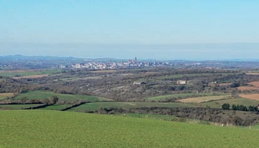
Le bassin de la Briane - Juin 2020.

C'est notamment lors de ces diagnostics que les systèmes agricoles en présence seront plus précisément caractérisés, avec l'identification des potentielles pratiques tant à risques que bénéfiques pour les cours d'eau et milieux aquatiques. Ces diagnostics, animés par des techniciens de l'Adasea d'Oc, ont pour but d'aller à la rencontre d'une bonne vingtaine d'exploitants agricoles (Olip et Briane cumulés) afin de récolter leurs points de vues sur les actions à mener selon le calendrier des projets (voir ci-dessous).