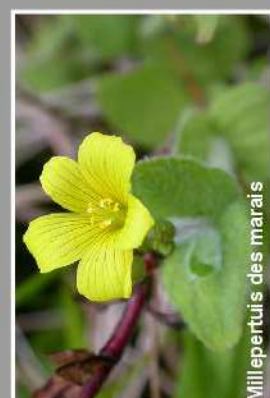
Millepertuis des marais

Combien de villages, de particuliers, de stabulations, d'auges bénéficient d'une eau de qualité grâce au travail des zones humides ?