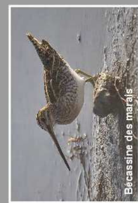
Becassine des marais