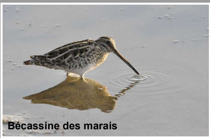
Bécassine des marais