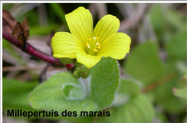
Millepertuis des marais

En effet, avec la végétation et les micro-reliefs des prairies humides et tourbières, l'eau stationne avant de s'infiltrer ou de rejoindre les cours d'eau. Cet écoulement, plus lent, permet la filtration mécanique et l' épuration chimique de l'eau .