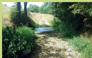
Stabilisation d'un passage à gué dans le cadre des travaux du PPG.

La mise en oeuvre du plan pluriannuel de gestion des cours d'eau (PPG) se poursuit en 2018 sur le bassin de la Serène. Un chantier est prévu sur une portion amont de la Petite Serène (communes de La Capelle-Bleys et du Bas Ségala).