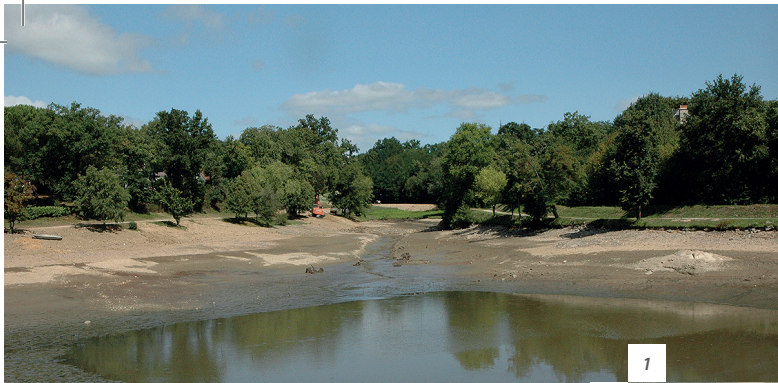
1. Vidange du plan d'eau de Saubayre à La Fouillade