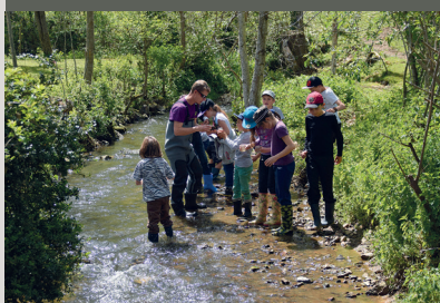
« Mon école, mon cours d'eau » à La Bastide l'Évêque (mai 2017).

Dans le cadre de l'édition 2017, pas moins de 144 élèves des communes concernées par le bassin versant de la Serène ont participé à l'opération « Mon école, mon cours d'eau ». À travers ce projet de communication et sensibilisation, les écoliers bénéficient d'une demi-journée d'animation sur le terrain, généralement sur un ruisseau localisé à proximité de leur établissement. Des ateliers ludiques en bord de cours d'eau permettent d'aborder différents thèmes en fonction des possibilités offertes par le site. L'objectif recherché est bien de faire découvrir la richesse des milieux aquatiques et d'inciter ainsi à les préserver. Des professionnels encadrent ces animations financées par l'Agence de l'Eau Adour Garonne, le conseil départemental de l'Aveyron, et les collectivités adhérentes au SMBV2A.