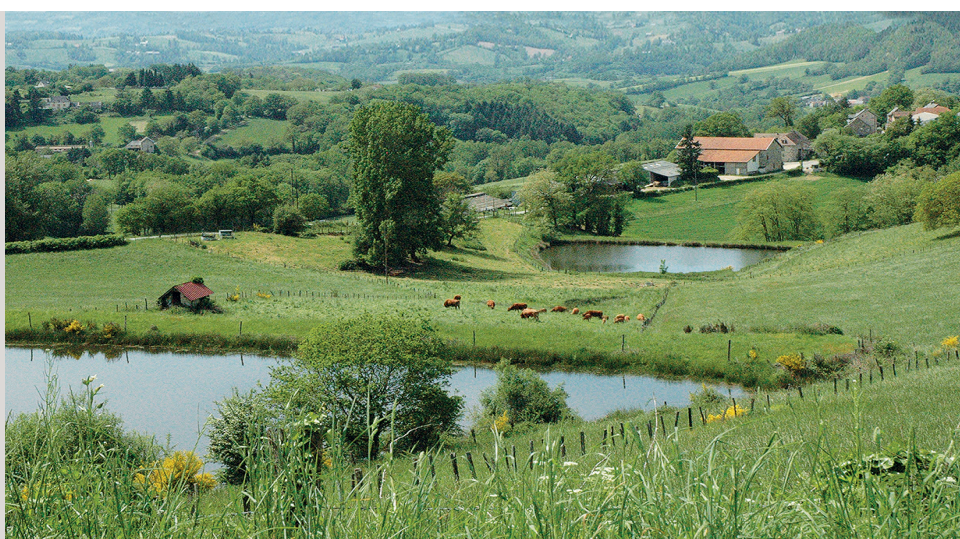
Plans d'eau sur le bassin de la Petite Serène (Lunac).