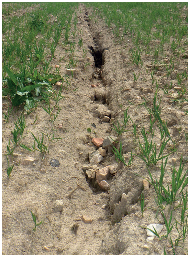
Érosion de versant sur le bassin de la Serène de Sanvensa.

POUR TOUT RENSEIGNEMENT SUR CES NOUVEAUX DISPOSITIFS (y compris concernant les inscriptions sur les diagnostics), veuillez contacter directement le SMBV2A (coordonnées en p. 4).