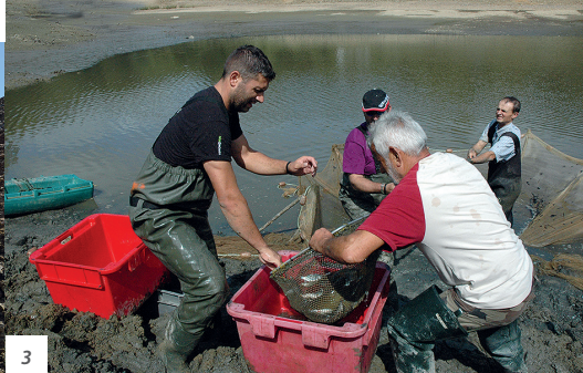
2. Moine hydraulique sur le plan d'eau de Saubayre à La Fouillade.