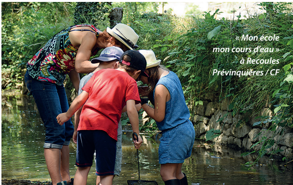
« Mon école mon cours d'eau » à Recoules Prévinquières / CF