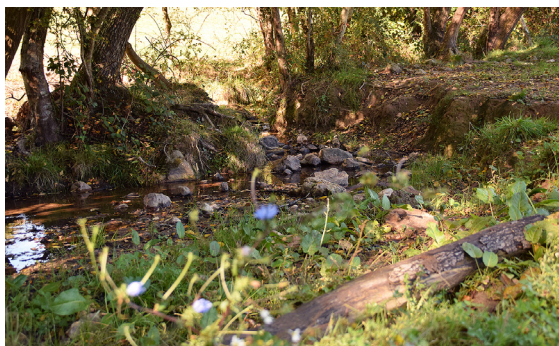
Le ruisseau La Fouillade