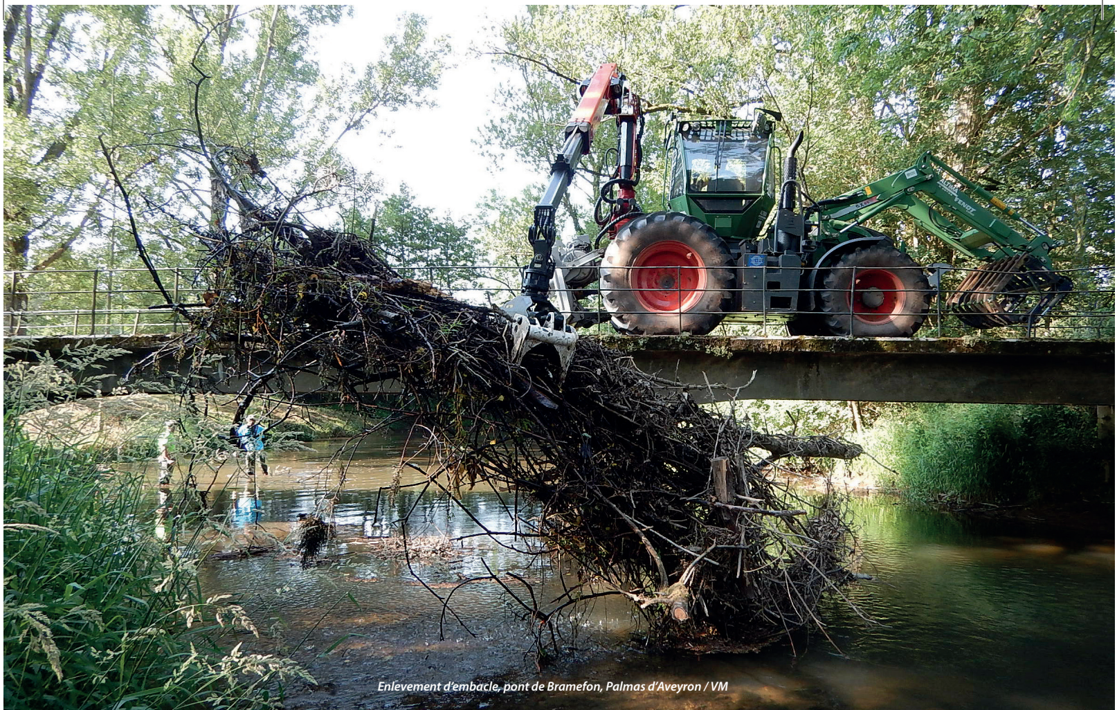
Enlèvement d'embâcle, pont de Bramefon, Palmas d'Aveyron