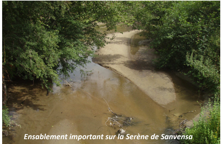
Enablement important sur la Serène de Sanvensa