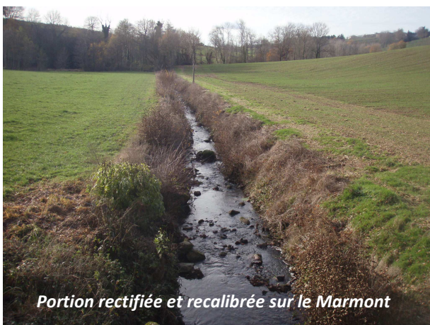
Portion rectifiée et recalibrée sur le Marmont