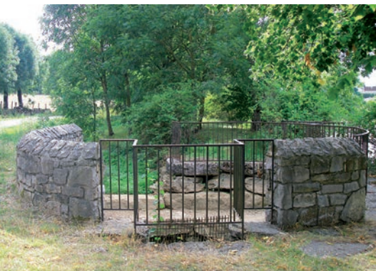
Perte du trou du Souci (Pierrefiche d'Olt)