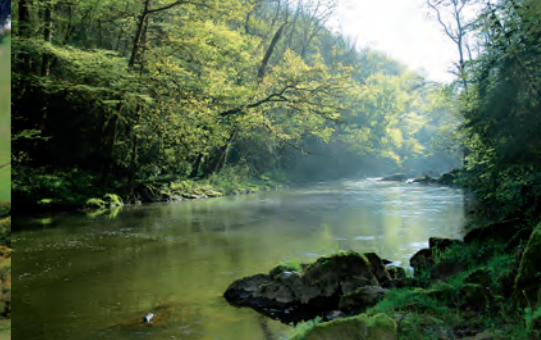
Vieux pont du Monastère, station d'épuration de Bénéchou et gorges de l'Aveyron en aval du pont du Cayla.